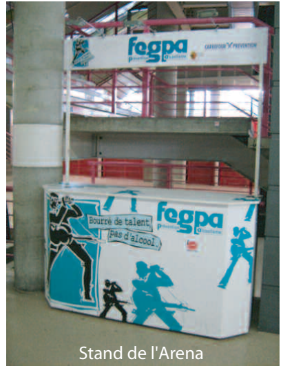
Stand de l'Arena