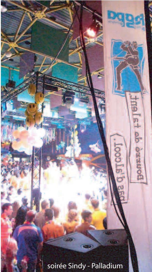
soirée Sindy - Palladium